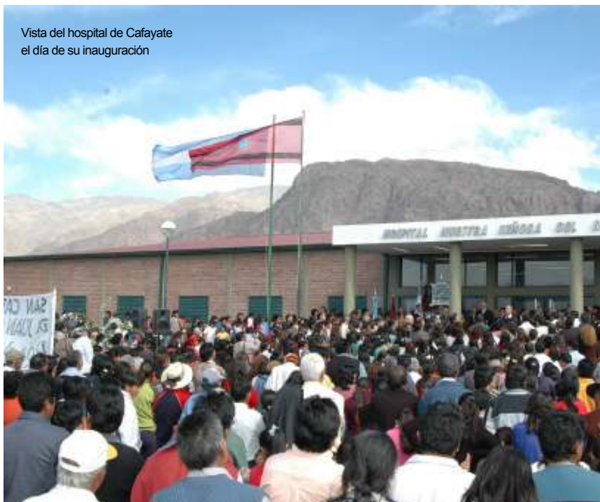
Vista del hospital de Cafayate el día de su inauguración