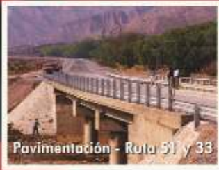
Pavimentación - Ruta 51 y 33

Las imágenes de las principales obras de infraestructura social y productiva sintetizan el resultado de un esquema de trabajo que comenzó bajo un slogan de campaña simple, pero cuya contundencia se trasunta ahora en resultados visibles. Aquel Orden, Trabajo y Producción, propugnaba reformular el funcionamiento del Estado y a partir de esa dinámica mostrar de que Salta no era una provincia inviable. El Estado dejó paulatinamente de ser la fuente de conflictos para convertirse en dinamizador de la sociedad, aportando las obras necesarias para mejorar la producción, asegurar inversiones privadas, potenciar las posibilidades de la gente a través de la educación, fomentar las actividades culturales, desarrollar el potencial creativo de industriales, empresarios y comerciantes, armonizar los intereses de quienes desean el progreso, contener y orientar a los jóvenes, brindar los servicios esenciales y garantizar un clima de convivencia y armonía social, dentro del respeto a nuestras tradiciones, el culto a nuestra tierra y a la herencia de estirpe gaucha que nos caracteriza. Siempre abiertos al desafío de insertar a Salta en el mundo globalizado que permita un contacto fluido con otras culturas, al tiempo que facilita captar inversores para un territorio que todavía requiere esfuerzo y constancia para corregir la enorme asimetría que nos separa de la Argentina central.