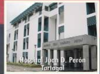
Hospital Juan D. Perón Tartagal