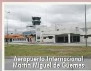
Aeropuerto Internacional Martín Miguel de Güemes