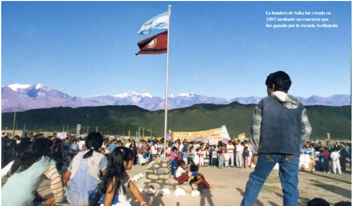
La bandera de Salta fue creada en 1997 mediante un concurso que fue ganado por la escuela Avellaneda.

P ara 1997 ya la situación de la Provincia había cambiado mucho. Se logró superar el estado de conflicto social permanente, normalizar y mejorar los servicios esenciales que presta el Estado y ejecutar un vastísimo plan de obras en el interior y en la Capital. Salta había ganado presencia regional e internacional.