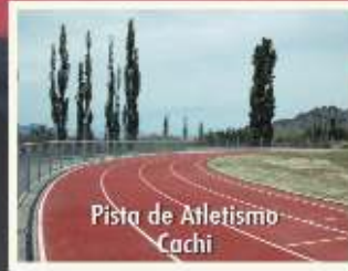
Pista de Atletismo Cachi