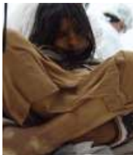
El hallazgo de los "Niños del Lullailaco" conmovieron al mundo científico.

145 familias de los barrios Virgen de Rosario de San Nicolás y Martín Miguel de Quemes recibieron terrenos fiscales. Inauguraron el tercer tramo del acceso a Salta. Entregaron 300 viviendas en Orán. Aeropuerto 2000 se hace cargo de la terminal aérea. Desde 1996 a 1999 la provincia entregó créditos por $ 3.500.000 destinados a apoyo para microemprendimientos productivos. Se entregaron 336 viviendas en Barrio Juan Pablo II.