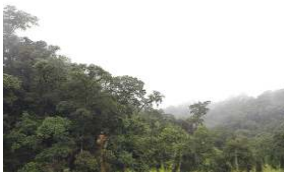
LA UNESCO DESTACO LA PROTECCION DE LAS YUNGAS.