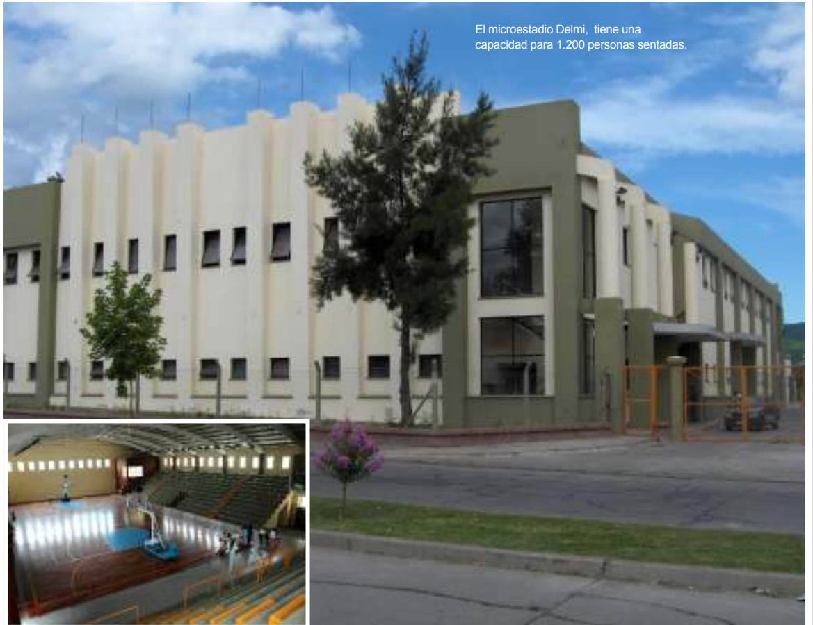
El microestadio Delmi, tiene una capacidad para 1.200 personas sentadas.

También se presentaba el juego "Tomboleta" para promover la lucha contra la evasión. El objetivo era reducir la evasión de impuestos con un control directo de los consumidores en el momento de efectuar las compras en todos los comercios exigiendo compro-