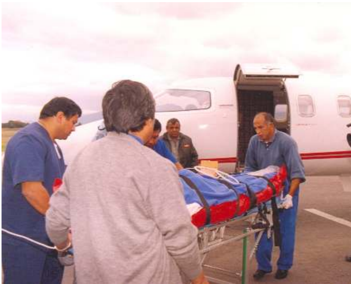
En 1996, el nuevo avión sanitario de la provincia estaba dotado con instrumento de alta tecnología.

Los municipios firmaron un Convenio de Colaboración Turística con el Gobierno Provincial para coordi-