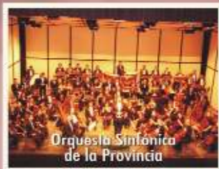
Orquesta Sinfónica de la Provincia