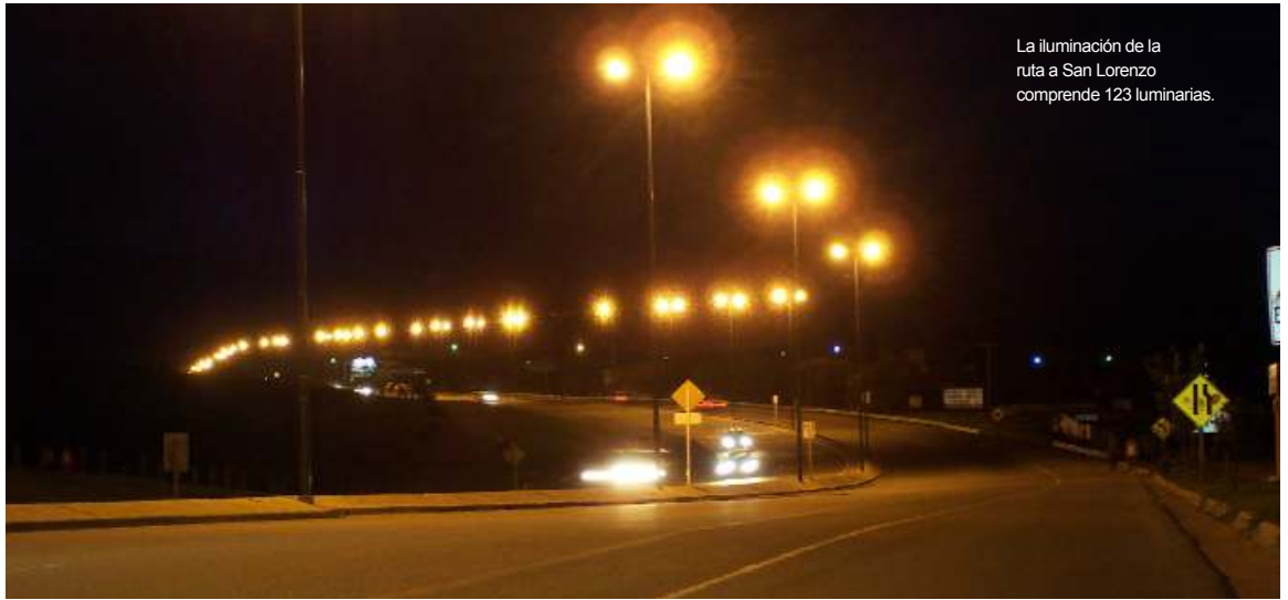
La iluminación de la ruta a San Lorenzo comprende 123 luminarias.

En materia de obra pública se destacan la inauguración de la iluminación y el inicio de las obras de repavimentación de la ruta a San Lorenzo, el comienzo de la pavimentación de la ruta 86, la rehabilitación de la ruta provincial 47 en la zona de Cabra Corral, la inauguración de nuevos tramos de pavimentación de la ruta nacional 51 cuya ejecución estuvo a cargo de la provincia con devolución de fondos acordada con la nación, la habilitación del nuevo Hospital de Aguaray, las obras de restauración de la iglesia de La Viña, el primer polimodal de la pro-