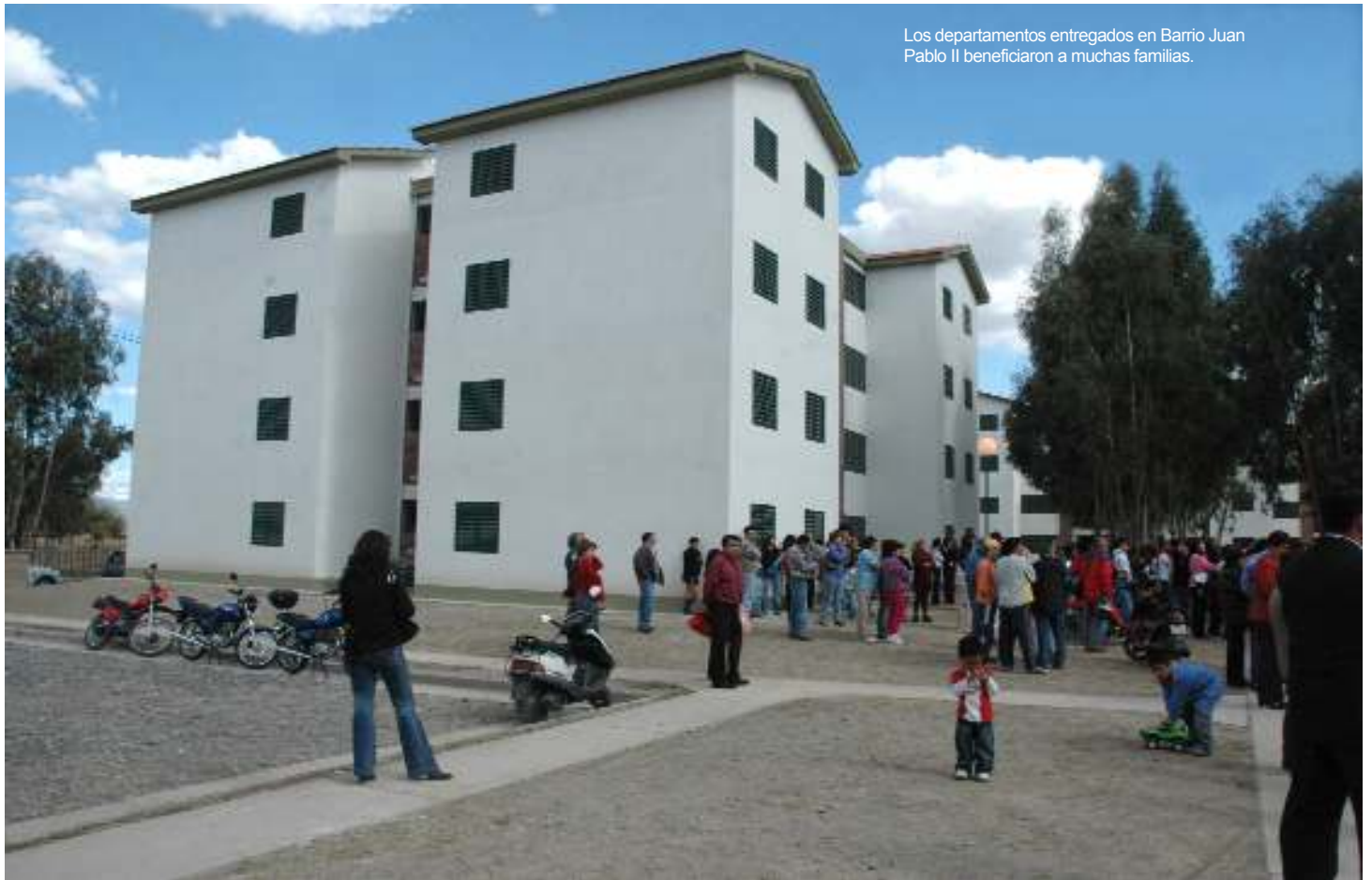
Los departamentos entregados en Barrio Juan Pablo II beneficiaron a muchas familias.

Los sectores educativo y productivo se convirtieron en claves de la transformación. Los primeros llegando a 186 días de clase y en el aspecto económico buscando el perfil ideal para salir a competir.