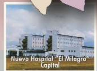
Nuevo Hospital "El Milagro" Capital