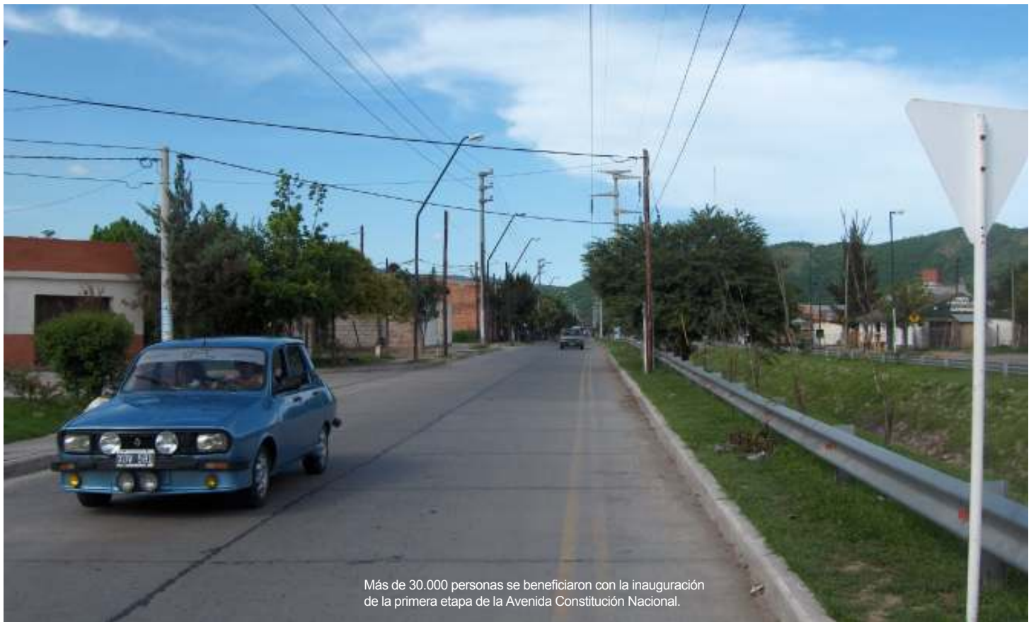
Más de 30.000 personas se beneficiaron con la inauguración de la primera etapa de la Avenida Constitución Nacional.

E n el año 2000, el gobernador Juan Carlos Romero iniciaba su segundo mandato. Con un plan de gobierno definido iniciado en 1995, se evidenciaban notables cambios en la historia salteña. Eficiencia del Estado, Calidad Educativa y Solidaridad Social constituían los postulados filosóficos para la nueva gestión.