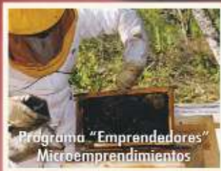
Programa "Emprendedores" Microemprendimientos