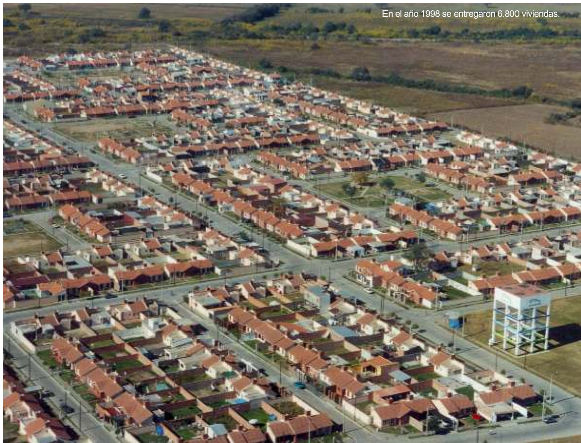
En el año 1998 se entregaron 6.800 viviendas.

Barrios como Palermo I, el Universitario con el nuevo colegio secundario Batalla de Salta, Santa Ana II con el colegio 11 de Septiembre, Bº Parque General Belgrano con el colegio Juana Manuela Gorriti o el secundario de Barrio Limache, vieron la luz en la Capital; mientras que la escuela técnica