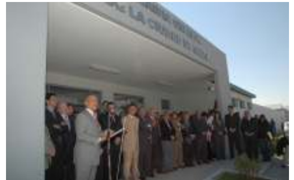
El puente de la Kennedy, el gasoducto de la Puna y la alcaldía son obras de gran trascendencia.

suales condiciones climáticas, que derivó en la caída del puente sobre el río Seco, en la ruta nacional 34 y las consecuencias que se vivieron en los departamentos del Norte.