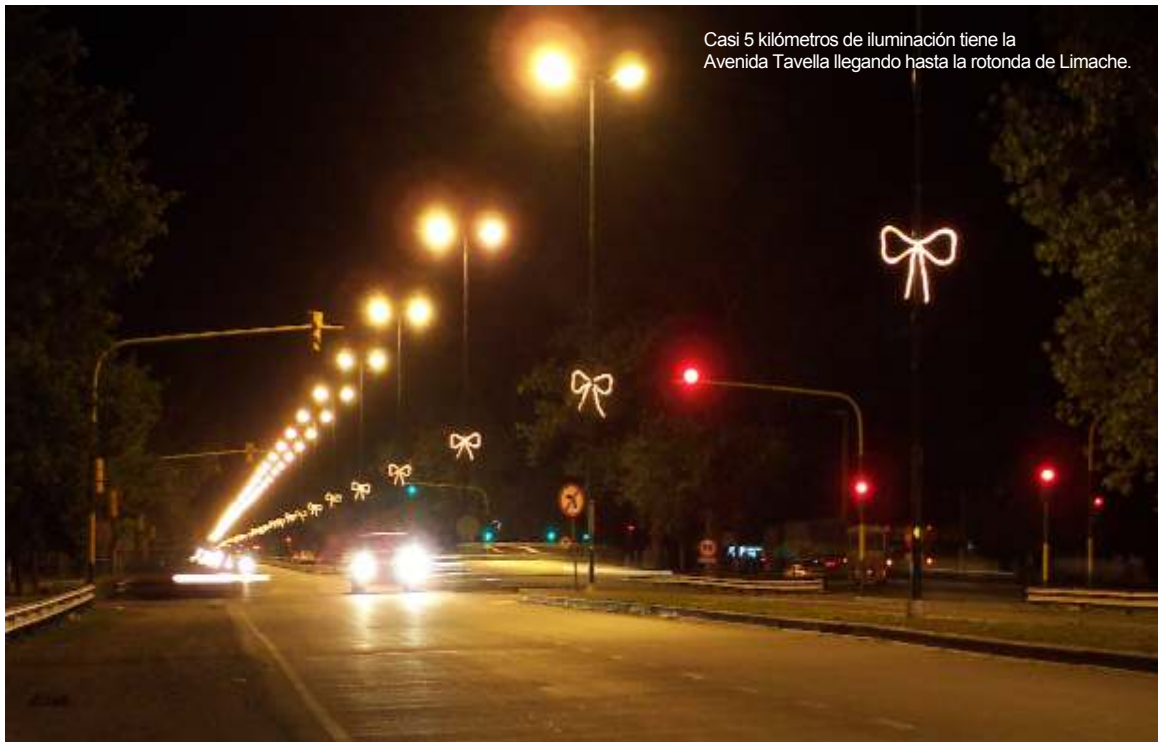
Casi 5 kilómetros de iluminación tiene la Avenida Tavella llegando hasta la rotonda de Limache.

En materia de obra pública se destacan la remodelación y recategorización del Aeropuerto Internacional Mar-