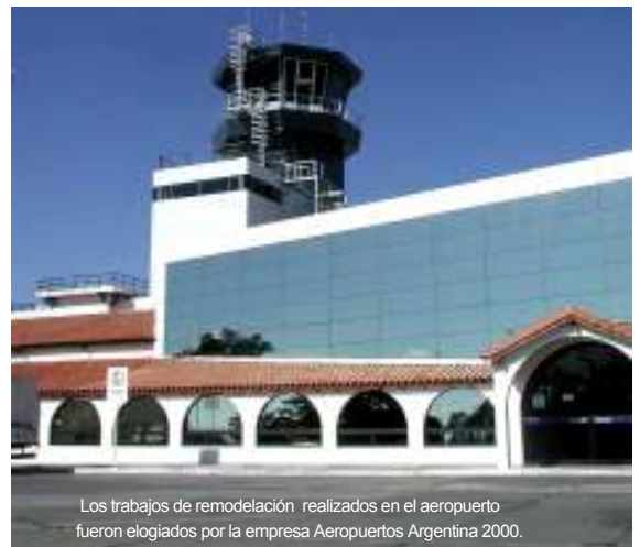
Los trabajos de remodelación realizados en el aeropuerto fueron elogiados por la empresa Aeropuertos Argentina 2000.

En abril de 1.999, El arqueólogo y antropólogo Johan Reinhard, junto al equipo que participó de la expedición al volcán Lullailaco, presenta una de las tres momias y parte del material filmico sobre los hallazgos producidos meses antes por la misión del National Geographic, razón por la que el gobernador Juan Carlos Romero anuncia la creación de un centro especializado para el estudio y