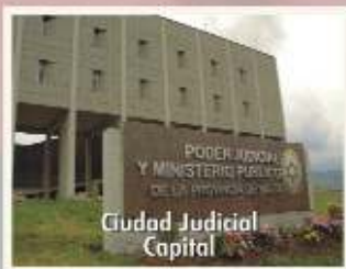
Ciudad Judicial Capital