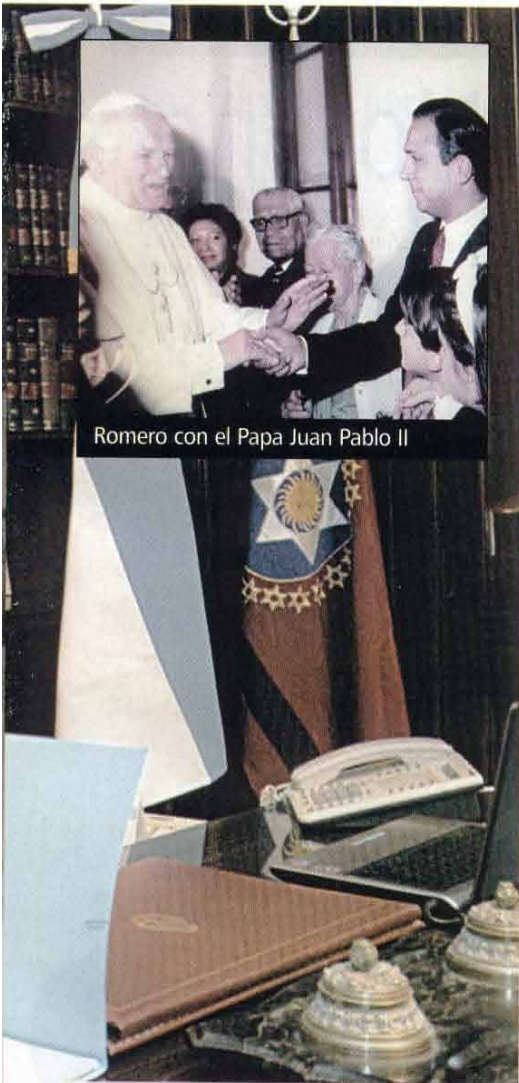
Romero con el Papa Juan Pablo II