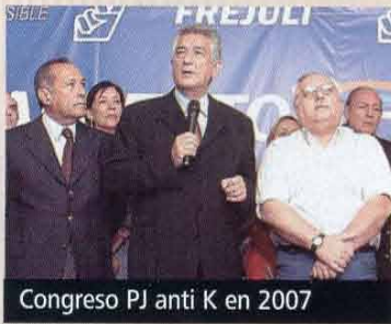
Congreso PJ anti K en 2007

-Sí, seguramente en el futuro algunos de ellos se reunirán, pero en esto debo decir que no creo que lo que deba venir sean las personas, lo que falta al justicialismo es tener programas, incluso diferentes; si no estamos de acuerdo con algo que el Gobierno hace, lo que debemos hacer es tener un programa alternativo. No creo en la reunión de dirigentes exclusivamente para elegir quién es el próximo candidato.