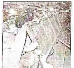
Incidentes frente al Congreso

El episodio fue el climax de una jornada signada por la tensión entre los ruralistas y los agentes de policía, que rodearon el edificio para evitar incidentes. Desde la mañana, el titular de la Federación Agraria,