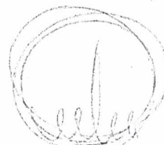
DR. JUAN CARLOS ROMERO SENADOR NACIONAL

Solicita al Poder Ejecutivo que provea las medidas necesarias para la construcción de una ciclovía que recorra la Ruta Nacional N° 50 en el tramo comprendido entre las localidades de Pichanal y San Ramón de la Nueva Orán.